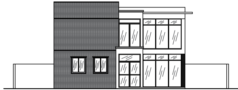
○ ELEVACION FRONTAL