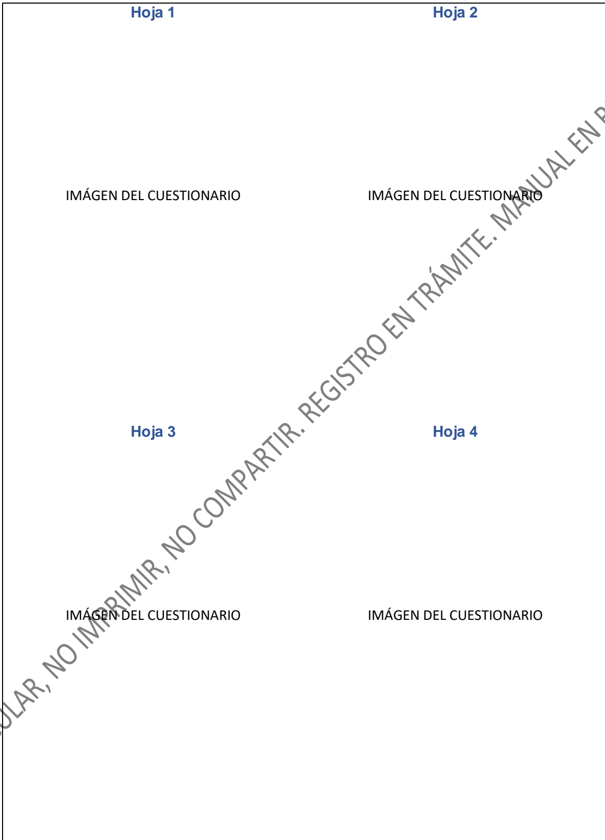
Figura 2. Estructura de las hojas de respuesta